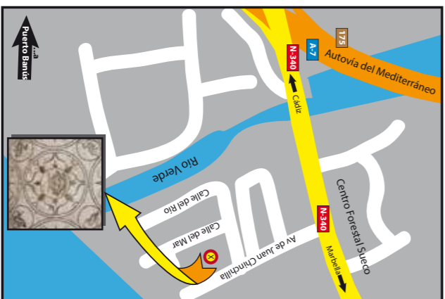
Villa Romana de Rio Verde